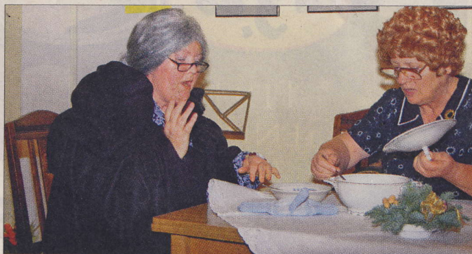
Der Sketch „Lecker Rumsopp“ kam gut an.

chen dieser ganz besonderen Zeit auf den Grund zu gehen. Im zweiten Teil des Abends sorgten die Döntjespölers aus Hage und ihre Gäste aus Norddeich mit gleich drei Auftritten für heitere Akzente. Eine reich bestückte Tombola, bei der es nur Gewinner gab, und natürlich der Besuch des mit Geschenken nicht geizenden rot gekleideten bärtigen Mannes „von draußen vom Walde“ rundeten die letzte Veranstaltung des Vereinsjahres 2010 ab.